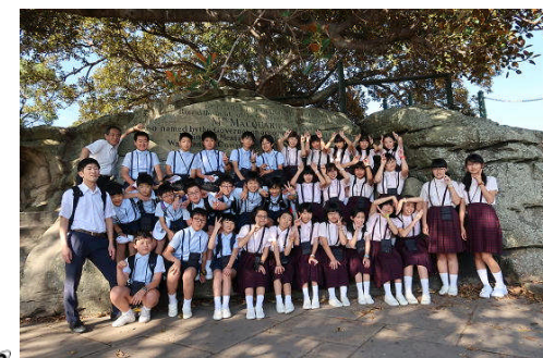
マッコリーズポイント