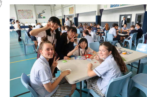
レッドランズカレッジ