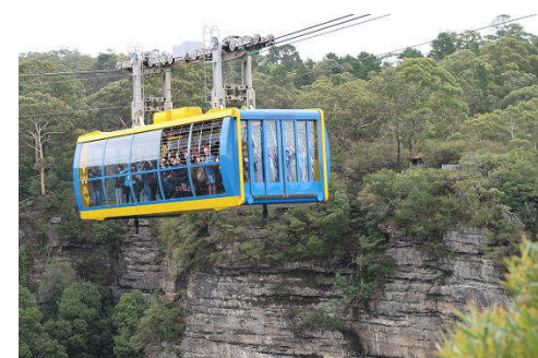
ブルーマウンテンズ

2月24日（日）～3月2日（土）の期間で6年生はオーストラリア修学旅行に出かけました。シドニー到着後、順調にスケジュールを進め、オーストラリアの自然や文化、そして人々との交流を満喫しました。中でも、ブリスベンの姉妹校レッドランズカレッジでの交流会は、昨年10月に留学生が本校を訪れたということもあり、うちとけた雰囲気と有意義な交流になりました。この旅行が児童たちにとって人生の大きな糧になることを願っています。