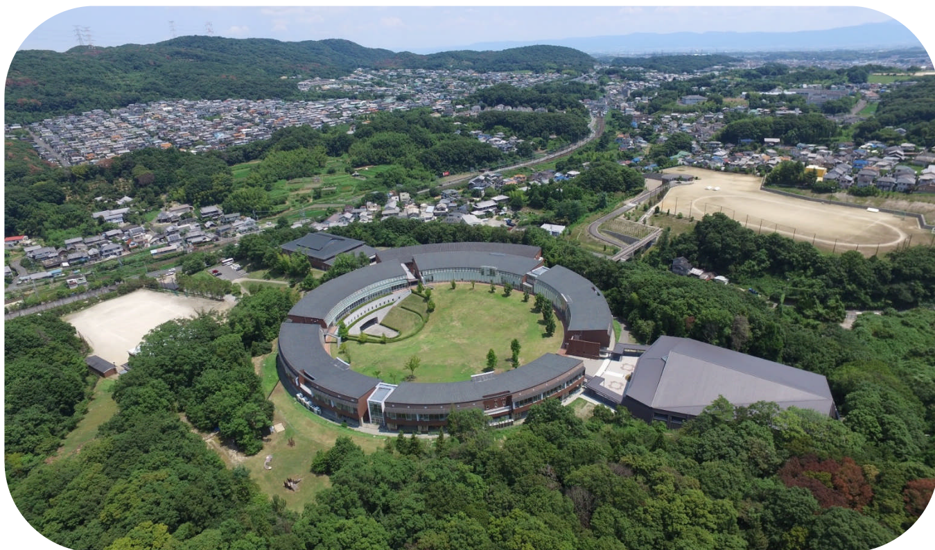
智辯学園奈良カレッジを上空から撮影

智辯学園奈良カレッジは、“誠実・明朗”-真心のある明るく元気な子-に育ててほしいとする親の願いをかなえるため、「能力を最大に伸ばす」「豊かな人間性を培う」という教育理念を基盤として「真・善・美・聖」の高い価値を身につけた人材の育成に努めている学校です。どうか実際に本校に来ていただいて、本校教育や児童と教員の関わり、施設や設備をぜひともご覧いただければと思っています。説明会や体験会のご参加を心よりお待ちしております。