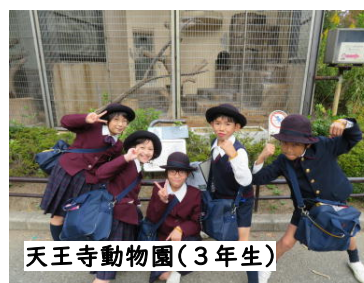
天王寺動物園(3年生)