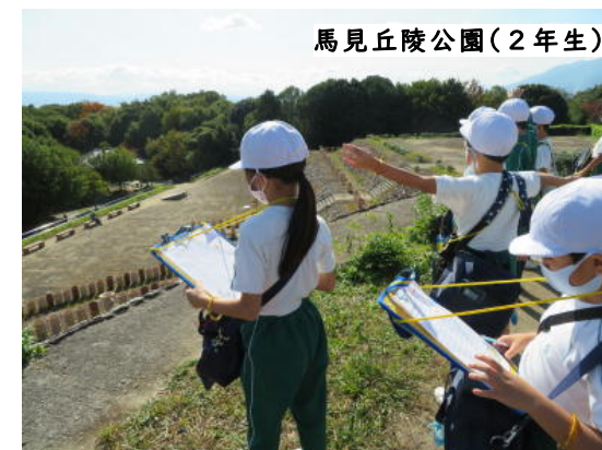
馬見丘陵公園(2年生)