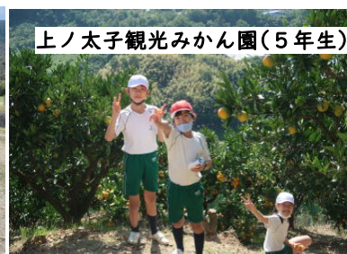
上ノ太子観光みかん園(5年生)