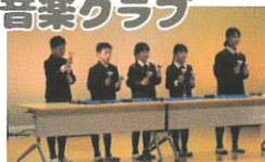
ボイスアンサンブル「上を向いて歩こう」 ハンドベル「はじめの一步」