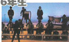
発表「Thanks to you...」 合唱「いのちのうた」 合奏「U」「アイドル」