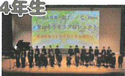
合唱 「里山」「ふるさと」