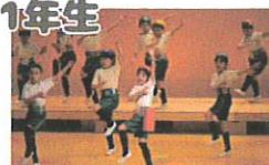
劇「カレッジせんたい イチネンジャー」