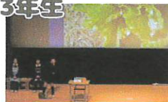
発表 「みんなの白菜」