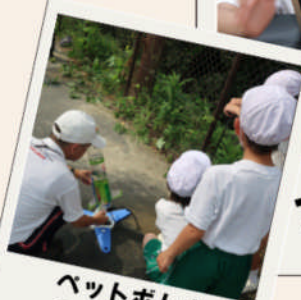
ペットボトル ロケット作り