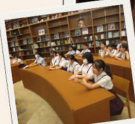
図書館 サポーターズ