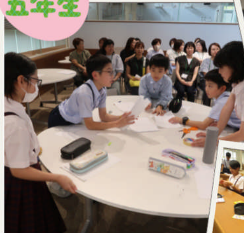
中学部授業体験会