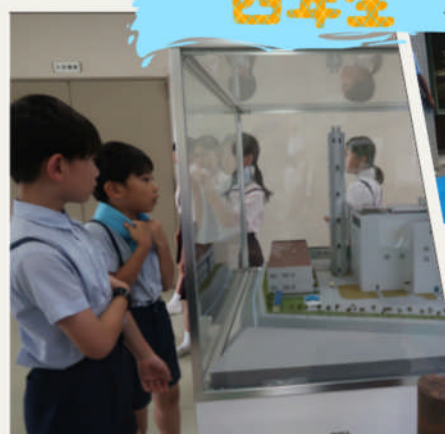
柏羽藤クリーンセンター 社会見学