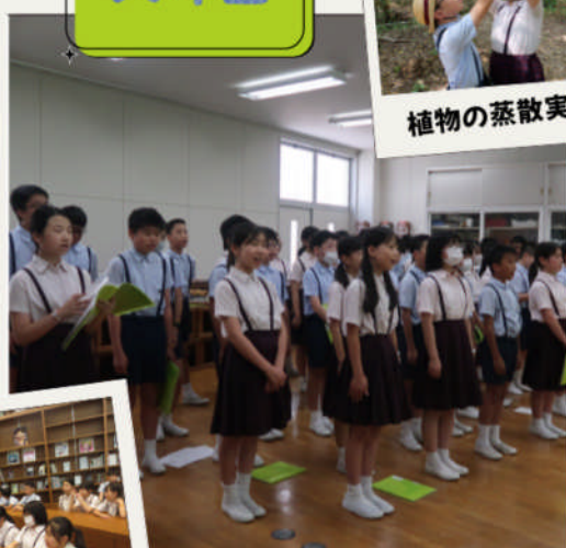
シニア会にむけて 合唱練習