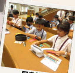
図書館 サポーターズ