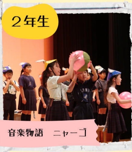
音楽物語 ニャーゴ