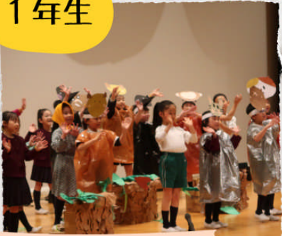
1年生の サツマイモノガタリ