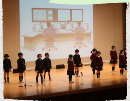
奈良カレッジ 通信指令室24時