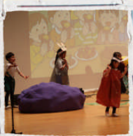
暗唱 「くちびるたいそう」