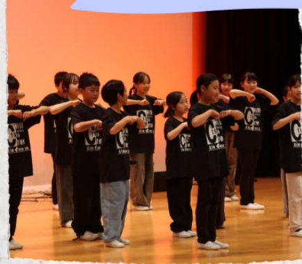
Stomp ~Aim4 One Team~