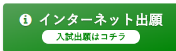
こちらのバナーを、クリックしてください。